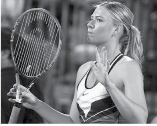
ပြိုင်ပွဲ၌ ပါဝင်ယှဉ်ပြိုင်ခွင့်ရရှိမည်ဖြစ်သည်။ အဆိုပါကိစ္စနှင့်ပတ်သက်၍ ကမ္ဘာ့အဆင့်တစ် တင်းနစ် မယ်ဟောင်း ကာရိုလင်းဂရီဇီယာကီက ရှာရာပိုဗာ၏ Wildcards ဖြင့် ပြိုင်ပွဲသို့ ပြန်လည်ယှဉ်ပြိုင်ခွင့်ရရှိရန် လုပ် ဆောင်ခြင်းသည် အခြားသောကစားသမားများအား မထိမဲ့မြင် လုပ်ဆောင်ခြင်းပင်ဖြစ်သည်ဟု ပြင်းပြင်းထန်ထန် ဝေဖန်ခဲ့သည်။

တားမြစ်ဆေးဝါးများ သုံးစွဲမှုဖြင့် တင်းနစ်ပြိုင်ပွဲများမှ ထုတ်ပယ်ခြင်းခံခဲ့ရသည့် ရုရှားတင်းနစ်မယ် မာရီယာရှာရာ ပိုဗာကို လာမည့်တင်းနစ်ပြိုင်ပွဲများတွင် ပါဝင်ယှဉ်ပြိုင်ခွင့်ရ ရရှိရန်အတွက် Wildcards စည်းမျဉ်းကို အသုံးပြု၍ဆောင် ရွက်သွားမည်ဖြစ်ကြောင်း အမျိုးသမီး တင်းနစ်အသင်း (WTA) ၏ အကြီးအကဲစတီဗင်ဆိုင်မွန်က ပြောကြားခဲ့သည်။ WTA သည် ရုရှားတင်းနစ်အဖွဲ့ချုပ်ထံသို့ အဆိုပါ Wild- cards စည်းမျဉ်းနှင့်ပတ်သက်၍ ပေးပို့ထားပြီး ဧပြီလတွင် ဂျာမနီနိုင်ငံ စတုဂတ်တွင် ကျင်းပမည့် ပိုင်ချီဂရင်းပရီတင်း နှစ်ပြိုင်ပွဲနှင့် မေလအတွင်း မက်ဒရစ်နှင့်ရောမတွင်ကျင်းပမည့် တင်းနစ်ပြိုင်ပွဲတို့တွင် မာရီယာရှာရာပိုဗာ ဝင်ရောက်ယှဉ်ပြိုင် ခွင့်ရရှိရန် ဆောင်ရွက်မည်ဖြစ်သည်။ အဆိုပါ Wildcards စည်းမျဉ်းနှင့်ပတ်သက်၍ အန်ဒီ မိုရေးအပါအဝင် လက်ရှိပြိုင်ပွဲဝင် တင်းနစ်ကစားသမားများ က ဝေဖန်ကန့်ကွက်ခဲ့ကြသည်။ ဂရင်းဆလင်းဆူဖလားကို ငါးကြိမ်ရရှိထားသည့် ရှာရာ ပိုဗာသည် မယ်လ်ဘိုနီယမ်ဆေးသုံးစွဲမှုဖြင့် ၁၅လကြာ အား ကစားလောကတွင် ပါဝင် ယှဉ်ပြိုင်မှုမှ ပိတ်ပင်ခံထားရပြီး နောက် ဧပြီ ၂၆ ရက်တွင်ကျင်းပမည့် ပိုင်ချီဂရင်းပရီတင်းနစ်