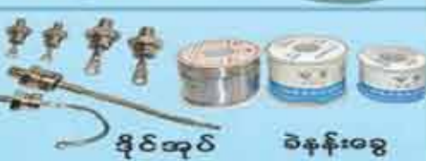
ခိုင်အုတ်