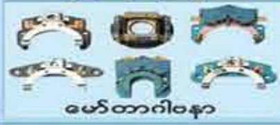
မော်တာဂါဝန်

ပစ္စည်းမှန်ဈေးနှုန်း သက်သာသည်။ လက်လီလက်ကားရောင်းချပေးသည်။ နယ်မှမှာယူလိုသူများဆက်သွယ်နိုင်ပါသည်။