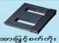
မီးအားဖြင့်စက်ကိုး