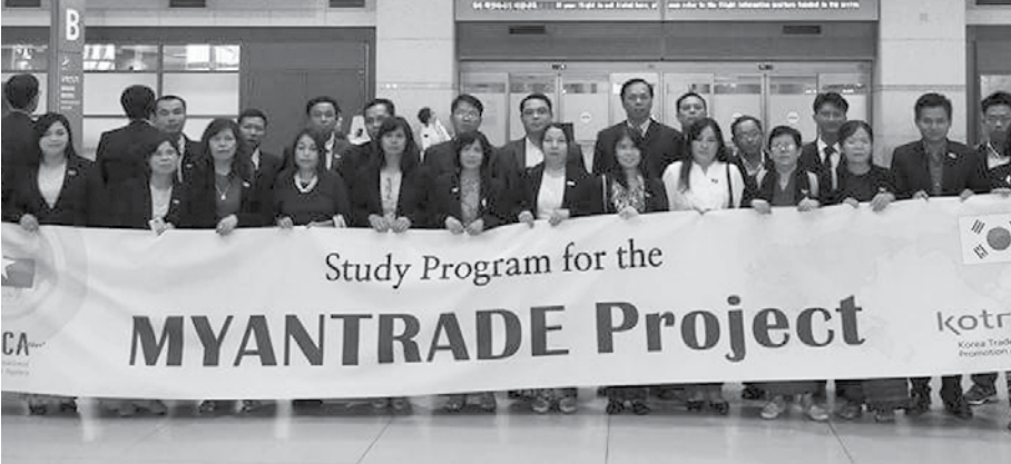
မျိုးသူ (ကုန်သွယ်မှုဖြင့်)

အလေ့အကျင့်ကောင်းများနှင့် ပတ်သက်၍ ၂၀၀၂ ခုနှစ်တွင် ကိုရီးယား၌ ပထမအကြိမ် သင်တန်းတစ်ခု လာတက်စဉ်ကလည်း ကြုံခဲ့ဖူးပါသည်။ ထိုစဉ်က ဆိုးလ်မြို့လယ်ရှိ COEX ဆိုသော အဆောက်အအုံကြီးတွင် တက်ရောက်ခဲ့ရပါသည်။ အဆိုပါ အဆောက်အအုံတွင် ပြခန်းများ၊ အခမ်းအနားကျင်းပရန် နေရာများ၊ ဈေးများ၊ စားသောက်ဆိုင်များတွဲဖက် ဆောက်လုပ်ထားပါသည်။ ထို့အပြင် ရေအောက်ပြတိုက်(Under Water World Museum) နှင့် ကစားကွင်းများပါ ပါဝင်ပါသည်။ ပြတိုက်နှင့် ကစားကွင်းကို