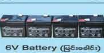
6V Battery (ပြင်းခေါင်း)