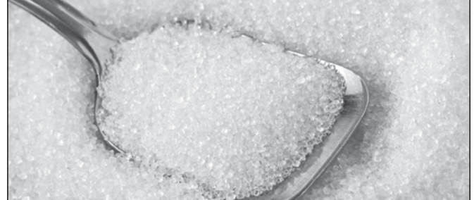
ပါက ၅၇၃၀ တန်ကျော် လျော့နည်းတင်သွင်းခဲ့ပါတယ်။ မတ်လ ၁၀ ရက်မှာ ဘုရင့်နောင် ကုန်စည်ဒိုင်ဇွေးအရ သကြားတစ်ပိဿာလျှင် ကျပ် ၁၄၀၀ မှ ၁၄၄၀ ကျပ်ရှိတယ်လို့ သိရပါတယ်။ မော်မော်အောင်

မြန်မာ-တရုတ်နယ်စပ်ရှိ မူဆယ်(၁၀၅) မိုင်ကုန်သွယ်ရေးဇုန်မှ မတ် ၄ ရက်မှ ၁၀ ရက် အထိ သီတင်းပတ်အတွင်း အမေရိကန်ဒေါ်လာ ၂၂ ဒသမ ၂၃၅ သန်းတန်ဖိုးရှိ Re-export သကြား ၃၄၈၁ တန်ကျော် တင်ပို့ခဲ့ပါတယ်။ ယခင် တစ်ပတ်က မူဆယ်မှသကြား ၄၈၈၇၀ တန်ကျော် တင်ပို့ခဲ့တဲ့ အတွက် ယခုတစ်ပတ်မှာ တရုတ်နိုင်ငံသို့ သကြားတန်ချိန် ၁၄၀၃၉ တန်ကျော် လျော့နည်း တင်ပို့ခဲ့တာတွေ့ရပါတယ်။ ချင်းရွှေဟော်မှ ယခင်တစ်ပတ်က သကြားဖြူ ၁၇ တန်ခွဲ တင်ပို့ခဲ့ပြီး ယခုတစ်ပတ်မှာ သကြားတင်ပို့မှု မရှိခဲ့ပါဘူး။