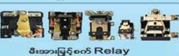
မီးအားဖြင့်စက် Relay