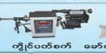
ကွိုင်ပတ်စက်