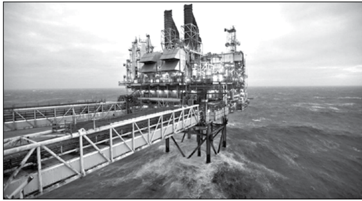
အမေရိကန်နိုင်ငံ၏ ရေနံစိမ်းသိုလှောင်လက်ကျန်မှာ စည် ၈ ဒသမ ၂ သန်းအထိ ရောက်ရှိခဲ့သည်။ ရေနံ စိမ်းစေးကွက်များတွင် သိုလှောင်လက်ကျန်မြင့်တက်လာသည့် အတွက် ဈေးနှုန်းအပေါ်တွင် ဖိအားပေးမှုများ ရှိနေကြောင်း ANZ ဘဏ်၏ အစီရင်ခံစာတွင် ဖော်ပြသည်။

ဒေါ်လာနှုန်းရှိခဲ့ရာ နိုဝင်ဘာ ၂၉ ရက်နေ့ကပိုင်း အနိမ့်ဆုံးနှုန်းဖြစ်သည်။ အိုပက်အဖွဲ့ဝင် နိုင်ငံများက ရေနံစိမ်းထုတ်လုပ်မှုလျော့ချရန် ယခင်နှစ် နှောင်းပိုင်းက သဘောတူညီခဲ့ပြီး နောက်ပိုင်း ရေနံစိမ်းဈေးနှုန်းများ ပြန်လည်မြင့်တက်ခဲ့သည်ကို အခွင့်ကောင်းယူပြီး အမေရိကန် စွမ်းအင်ကုမ္ပဏီများက ရက်သတ္တပတ် ရှစ်ပတ်မြောက်အဖြစ် ရေနံတူးစင်များကို ဆက်တိုက်တိုးချဲ့ခြင်းဖြစ်သည်။ ၂၀၁၇ ခုနှစ် ပထမနှစ်ဝက်တွင် တစ်ရက်လျှင် ရေနံစည် ၁ ဒသမ ၈ သန်း လျော့ချ၍ ထုတ်လုပ်ရန် အိုပက်အဖွဲ့နှင့် ရုရှားနိုင်ငံ အပါအဝင် အခြားသော ရေနံထုတ်လုပ်သည့်နိုင်ငံများက သဘောတူညီခဲ့ကြသည်။ ထိုသို့ထုတ်လုပ်မှုလျော့ချရန် ဆုံးဖြတ်ပြီး နောက်ပိုင်း ကမ္ဘာတွင် ရေနံထုတ်လုပ်မှုအများဆုံးဖြစ်သော