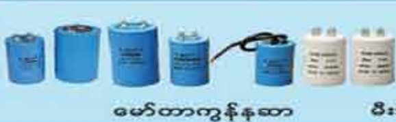
မော်တာကွန်ကော