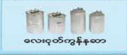
လေးငုတ်ကွန်ကော