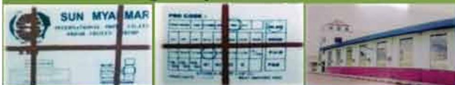
Packed Product Front And Back