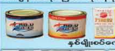
နပ်မျိုးစပ်ကော်