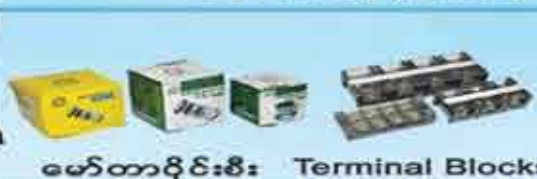
မော်တာပိုင်မီး Terminal Blocks