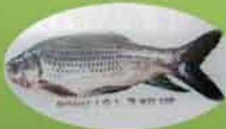
Prawns And Rohu Fish