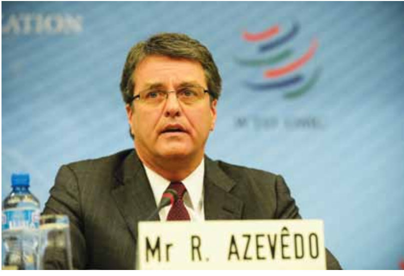
အယ်ပယ်ဒိုက WTO အနေဖြင့်လမ်းကြောင်းမှန်ပေါ်တွင် လျှောက်လှမ်းနေပါကြောင်း၊ WTO သည် လွန်ခဲ့သည့် နှစ်အနည်းငယ်ကတည်းကပင် အောင်မြင်မှုများကို ရရှိနေ

ပြီဖြစ်ပါကြောင်း၊ WTO သည် ၂၀၁၃ ခုနှစ်ကထက် ပိုမိုအင်အားကြီးထွားလာပါကြောင်း၊ WTO အနေဖြင့် ကုန်သွယ်မှု စီးပွားရေးကဏ္ဍတွင် အကျိုးအမြတ်များ ပိုမိုရရှိအောင်လုပ်ဆောင်ရမည်ဖြစ်ပါကြောင်း၊ ထို့ကြောင့် အားလုံးပါဝင်သည့် ကုန်သွယ်မှုစနစ်ကို တည်ထောင်၍ လုပ်ဆောင်လျက်ရှိပါကြောင်း ပြောကြားခဲ့သည်။