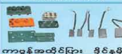
ကားကွန်အထိုင်ပြား