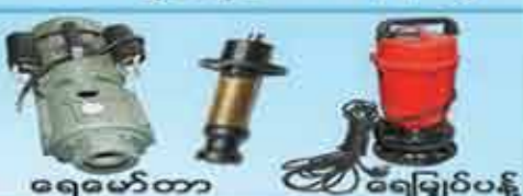
ရေမော်တာ