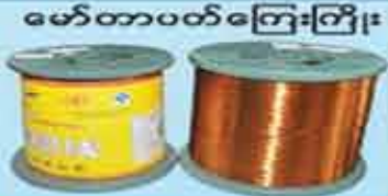
မော်တာပတ်ကြေးကြိုး