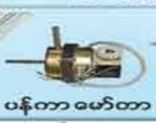
ပန်တာမော်တာ