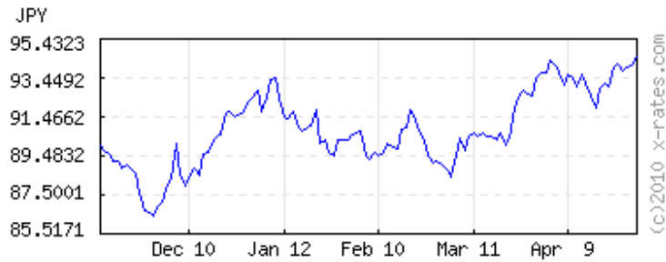
Japanese Yens to 1 USD ( invert,data )

120 days latest (Apr 30) 94.4874 lowest (Nov 30) 86.3809 highest (Apr 30) 94.4874