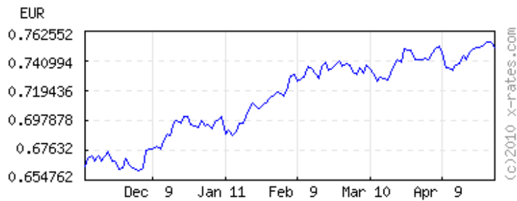
Euros to 1 USD ( invert,data )

120 days latest (Apr 30) 0.751033 lowest (Dec 3) 0.661376 highest (Apr 28) 0.755002