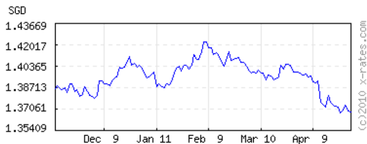
Singapore Dollars to 1 USD ( invert,data )

120 days latest (Apr 30) 1.36816 lowest (Apr 26) 1.36777 highest (Feb 5) 1.42247