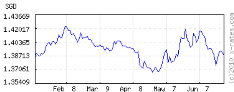
Singapore Dollars to 1 USD ( invert,data )

120 days latest (Jun 28) 1.38739 lowest (Apr 26) 1.36777 highest (Feb 5) 1.42247