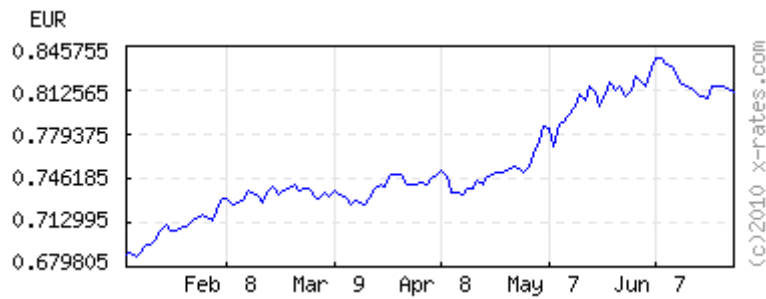
Euros to 1 USD ( invert,data )

120 days latest (Jun 28) 0.810438 lowest (Jan 13) 0.686672 highest (Jun 8) 0.837381