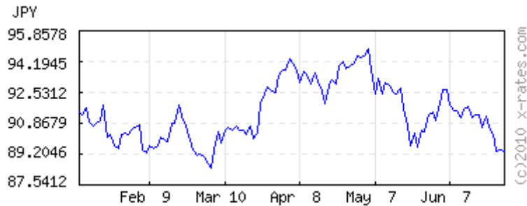
Japanese Yens to 1 USD ( invert,data )

120 days latest (Jun 28) 89.3508 lowest (Mar 4) 88.4255 highest (May 5) 94.9087