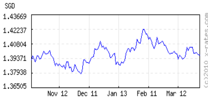
Singapore Dollars to 1 USD ( invert, data )

120 days latest (Apr 5) 1.39721 lowest (Dec 3) 1.37884 highest (Feb 5) 1.42247