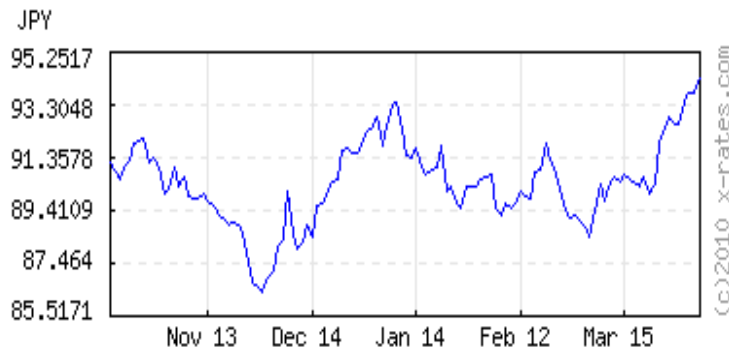
Japanese Yens to 1 USD ( invert, data )

120 days latest (Apr 5) 94.3086 lowest (Nov 30) 86.3809 highest (Apr 5) 94.3086